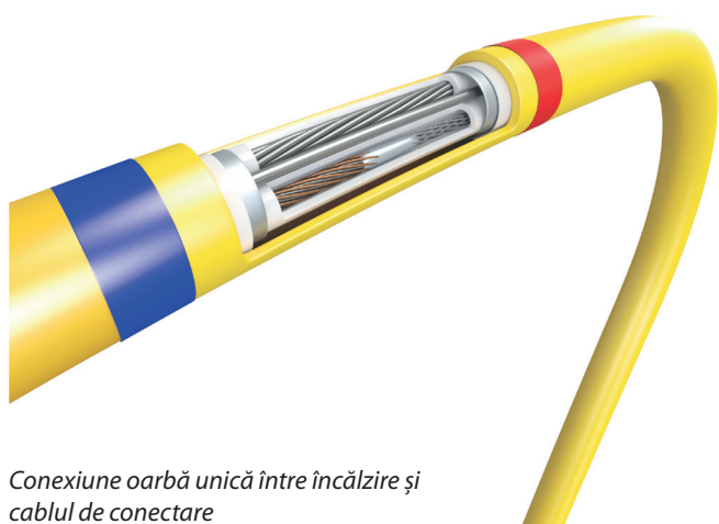
Conexiune oarbă unică între încălzire și cablul de conectare